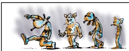
In gevoelige verhalen zijn de karakters dieren.

Alhoewel Nederland zich in het verleden op de kaart gezet heeft met het progressieve soft-drugsbeleid, hebben de meeste Nederlanders geen idee hoe dat nu eigenlijk in elkaar zit. Dat Nederland de laatste decennia beleidsmatig juist een heel andere koers gevaren heeft, is ook een publiek geheim.